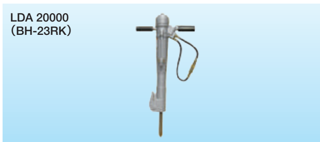
LDA 20000 (BH-23RK)