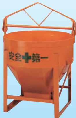
HC2 03020 (片開き)