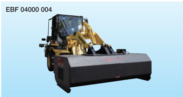
EBF 04000 004