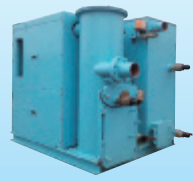
真空ポンプユニット (ASC-30P)