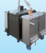
ミニバキューマー (R132)