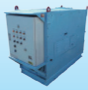
真空ポンプユニット (ASC-15P)